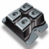
VS-UFB60FA20P Electro-Films (EFI) / Vishay DIODE GEN PURP 200V 30A SOT227