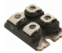
VS-UFB80FA20 Electro-Films (EFI) / Vishay DIODE MODULE 200V 40A SOT227