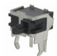
DDS002 C&K SWITCH SNAP ACTION SPST-NO 100MA