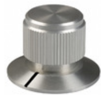
DDSPT-75-1-7 Kilo International KNOB KNURLED W/SKRT 0.236" METAL