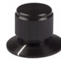
DDSPT-75-2-5 Kilo International KNOB KNURLED W/SKRT 0.250" METAL