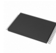
AT28HC64B-70TU Microchip Technology IC EEPROM 64KBIT 70NS 28TSOP