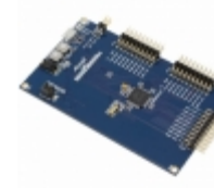
ATSAMD20-XPRO Micrel / Microchip Technology EVAL KIT XPLAINED PRO CORTEX-M0+