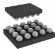
ATSAMD11D14A-UUT Microchip Technology IC MCU 32BIT 16KB FLASH 20WLCSP