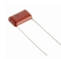
ECQ-E6563KFB Panasonic Electronic Components CAP FILM 0.056UF 10% 630VDC RAD