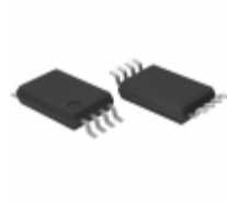
BR24T02FV-WE2 Rohm Semiconductor IC EEPROM 2KBIT 400KHZ 8SSOPB