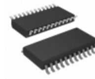
ICL3217EIB Intersil IC TXRX RS-232 3-5.5V ESD 24SOIC