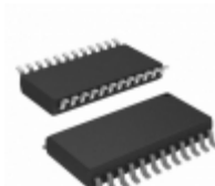
ICL3217ECB Intersil IC TXRX RS-232 3-5.5V ESD 24SOIC