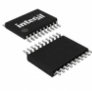
ICL3223EIV-T Intersil IC 2DRVR/2RCVR RS232 3V 20-TSSOP