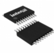
ICL3223ECVZ-T Intersil IC 2DRVR/2RCVR RS232 3V 20-TSSOP