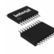
ICL3223EIVZ-T Intersil IC 2DRVR/2RCVR RS232 3V 20-TSSOP