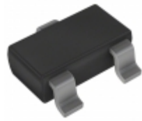
DDTA144TCA-7 Diodes Incorporated TRANS PREBIAS PNP 200MW SOT23-3