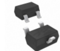
DDTA144TUA-7-F Diodes Incorporated TRANS PREBIAS PNP 200MW SOT323