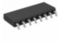
SY10EL34LZC Microchip Technology IC CLK GEN /2/4/6 5V/3.3V 16SOIC