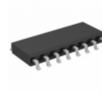
SY10EL34LZI-TR Microchip Technology IC CLK GEN /2/4/6 5V/3.3V 16SOIC