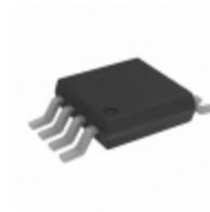
AD8223ARMZ-R7 Analog Devices Inc. IC OPAMP INSTR 200KHZ RRO 8MSOP