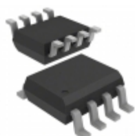
AD8223ARZ-R7 Analog Devices Inc. IC OPAMP INSTR 200KHZ RRO 8SOIC