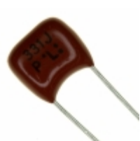
ECQ-P1H331JZ Panasonic Electronic Components CAP FILM 330PF 5% 50VDC RADIAL