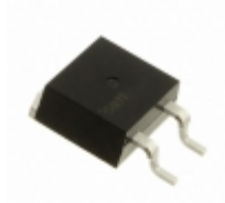
IXBA16N170AHV IXYS Corporation REVERSE CONDUCTING IGBT