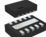
LTC2917HDDDB-B1#TRMPBF Linear Technology IC VOLT SUPERVISOR 10-DFN