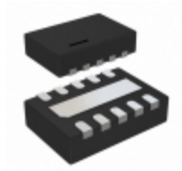
LTC2917HDDDB-B1#TRMPBF ADI (Analog Devices, Inc.) IC VOLT SUPERVISOR 10-DFN