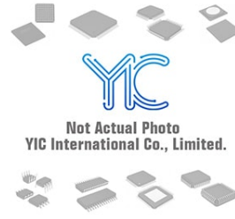
PIC24FJ32GA002T-E/SS MICROCH PIC24FJ32GA002T-E/SS MICROCH