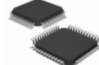
ADM1026JST-REEL7 ON Semiconductor IC CNTRL SYS REF/EEPROM 48LQFP