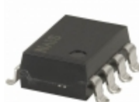
AQW410EHA Panasonic RELAY OPTO DPST-NC 100MA 8 SMD