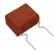
ECW-F2685JAB Panasonic Electronic Components CAP FILM 6.8UF 5% 250VDC RADIAL