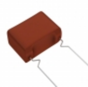
ECW-F2685JAQ Panasonic Electronic Components CAP FILM 6.8UF 5% 250VDC RADIAL