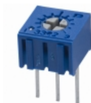
3362U-1-101 Bourns, Inc. TRIMMER 100 OHM 0.5W PC PIN TOP