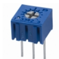
3362U-1-100R Bourns, Inc. TRIMMER 10 OHM 0.5W PC PIN TOP