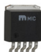
MIC39152WU-TR Microchip Technology IC REG LDO ADJ 1.5A TO263-5