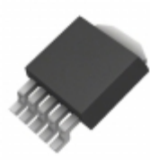
MIC39152WD-TR Microchip Technology IC REG LDO ADJ 1.5A TO252-5