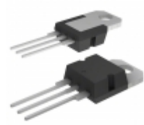
MIC39300-1.8BT Microchip Technology IC REG LDO 1.8V 3A TO220-3