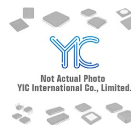
MIC39201-1.8BU MICREL MICREL TO-263-3