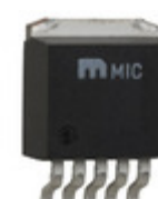
MIC39152WU Microchip Technology IC REG LDO ADJ 1.5A TO263-5