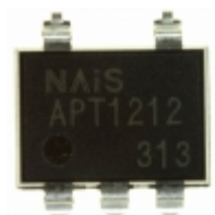
APT1212A Panasonic Electric Works OPTOISOLATOR 5KV TRIAC 6SMD