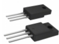
UGF18DCTHE3/45 Electro-Films (EFI) / Vishay DIODE ARRAY GP 200V 18A ITO220AB