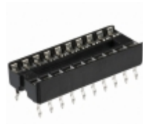
A 20-LC-TR Assmann WSW Components CONN IC DIP SOCKET 20POS TIN