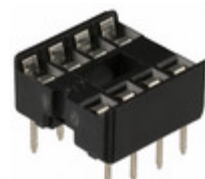
A 08-LC-TT Assmann WSW Components CONN IC DIP SOCKET 8POS TIN