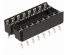
A 16-LC-TR Assmann WSW Components CONN IC DIP SOCKET 16POS TIN