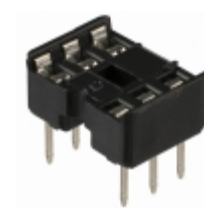
A 06-LC-TT Assmann WSW Components CONN IC DIP SOCKET 6POS TIN