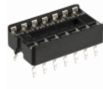
A 14-LC-TR Assmann WSW Components CONN IC DIP SOCKET 14POS TIN