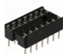
A 14-LC-TT Assmann WSW Components CONN IC DIP SOCKET 14POS TIN