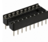
A 18-LC-TT Assmann WSW Components CONN IC DIP SOCKET 18POS TIN