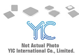
AT29C020-12PU AT AT29C020-12PU AT