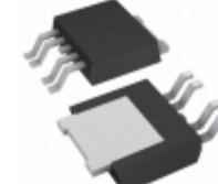
BD33KA5WFP-E2 Rohm Semiconductor IC REG LDO 3.3V 0.5A TO252-5