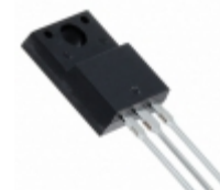
MBRF10100 SMC Diode Solutions DIODE SCHOTTKY 100V ITO220AC