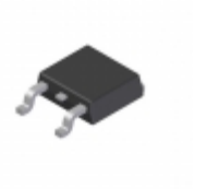
MBRD835L-T-F Diodes Incorporated DIODE SCHOTTKY 35V 8A DPAK