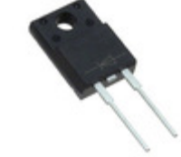
MBRF10100 C0G TSC (Taiwan Semiconductor) DIODE SCHOTTKY 100V 10A ITO220AC