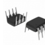
HCPL-7520-060E Broadcom Limited IC OPAMP ISOLATION 100KHZ 8DIP