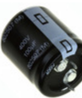
EET-HC2G221HF Panasonic Electronic Components CAP ALUM 220UF 20% 400V SNAP