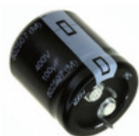
EET-HC2G271HA Panasonic Electronic Components CAP ALUM 270UF 20% 400V SNAP