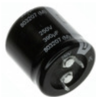
EET-HC2G271CA Panasonic Electronic Components CAP ALUM 270UF 20% 400V SNAP