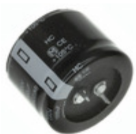
EET-HC2G271EA Panasonic Electronic Components CAP ALUM 270UF 20% 400V SNAP