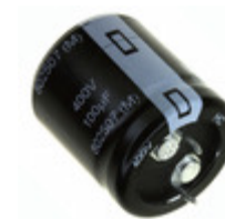
EET-HC2G221HA Panasonic Electronic Components CAP ALUM 220UF 20% 400V SNAP