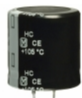
EET-HC2G271DA Panasonic Electronic Components CAP ALUM 270UF 20% 400V SNAP