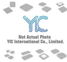
BC859C NXP BC859C NXP