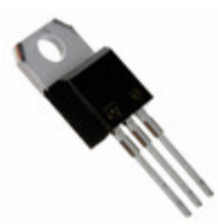
BUL510 STMicroelectronics TRANS NPN 450V 10A TO-220