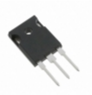
MJW21194 ON Semiconductor TRANS NPN 250V 16A TO247