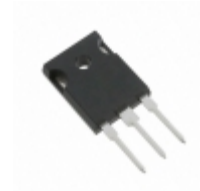
MJW21196 ON Semiconductor TRANS NPN 250V 16A TO247