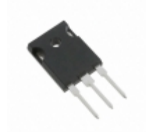
MJW21194G ON Semiconductor TRANS NPN 250V 16A TO247