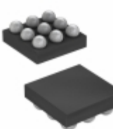
MAX4722EBL+ Maxim Integrated IC SWITCH DUAL SPST 9UCSP