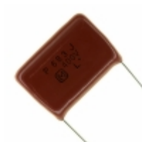
ECQ-P4683JU Panasonic Electronic Components CAP FILM 0.068UF 5% 400VDC RAD