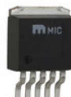
MIC37502BU Microchip Technology IC REG LDO ADJ TO263-5