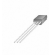
KSA1378GBU Fairchild/ON Semiconductor TRANS PNP 25V 0.3A TO-92S