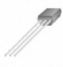
KSA1378GBU AMI Semiconductor / ON Semiconductor TRANS PNP 25V 0.3A TO-92S