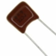
ECQ-B1H223JF Panasonic Electronic Components CAP FILM 0.022UF 5% 50VDC RADIAL