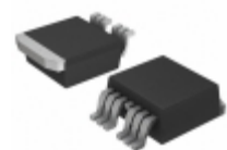
IXTA152N085T7 IXYS MOSFET N-CH 85V 152A TO-263-7