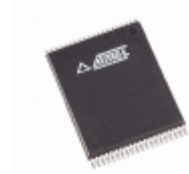
AT27BV4096-15VC Microchip Technology IC OTP 4MBIT 150NS 40VSOP