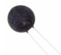
ICL320R530-01 Honeywell Sensing and Productivity Solutions ICL 0.5 OHM 20% 30A 32MM