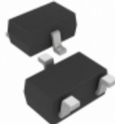
MCP131T-195I/LB Microchip Technology IC SUPERVISOR 1.95V LOW SC-70