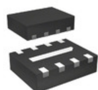
AD8354ACPZ-R2 Analog Devices Inc. IC RF GAIN BLOCK 8-LFCSP