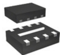
AD8353ACPZ-R2 Analog Devices Inc. IC RF GAIN BLOCK 8-LFCSP