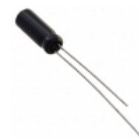
EEU-FC1V180H Panasonic Electronic Components CAP ALUM 18UF 20% 35V RADIAL