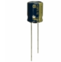
EEU-FC1V181 Panasonic Electronic Components CAP ALUM 180UF 20% 35V RADIAL