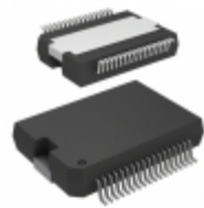
PEB 4364 T V1.2 Infineon Technologies IC SLIC VOICE ACCESS PDSO-36