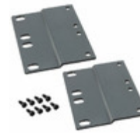
PEB2 Panduit THE PANDUIT PANEL EXTENDER BRACK