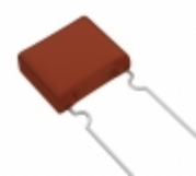
ECW-F2824RJA Panasonic Electronic Components CAP FILM 0.82UF 5% 250VDC RADIAL