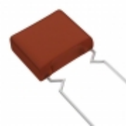
ECW-F2824JAQ Panasonic Electronic Components CAP FILM 0.82UF 5% 250VDC RADIAL