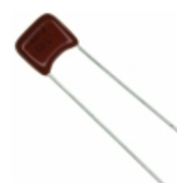
ECQ-B1331JF Panasonic Electronic Components CAP FILM 330PF 5% 100VDC RADIAL