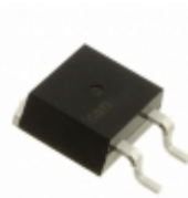
CLA30MT1200NPZ IXYS THYRISTOR PHASE THRU TO263AB