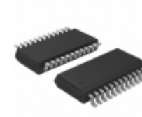
ADT7468ARQZ ON Semiconductor IC REMOTE THERMAL CTRLR 24QSOP