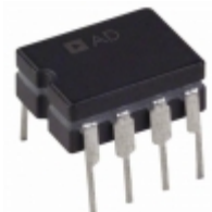
AD744AQ Analog Devices Inc. IC OPAMP JFET 13MHZ 8CDIP