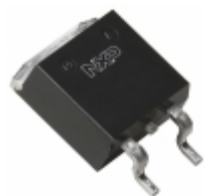
BYV29B-600,118 WeEn Semiconductors DIODE GEN PURP 600V 9A D2PAK