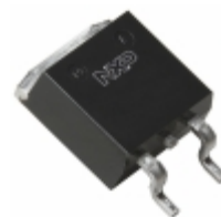
BYV29B-500,118 WeEn Semiconductors DIODE GEN PURP 500V 9A D2PAK