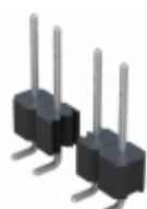
PREC040SBBN-M71RC Sullins Connector Solutions CONN HEADER .100" SNGL R/A 40POS