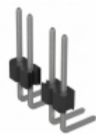
PREC040SBDN-M71RC Sullins Connector Solutions CONN HEADER .100" SNGL R/A 40POS