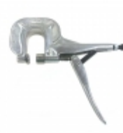
PRES-N-SNAP TOOL SCS PRES-N-SNAP TOOL