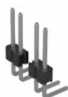
PREC040SBAN-M71RC Sullins Connector Solutions CONN HEADER .100" SNGL R/A 40POS